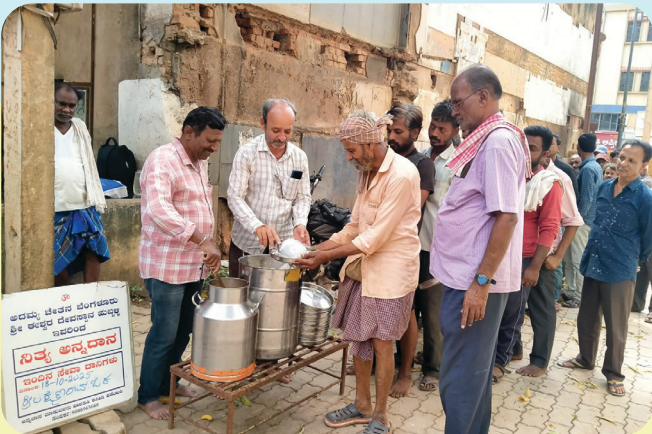
ಹುಬ್ಬಳ್ಳಿಯ ಶ್ರೀ ಈಶ್ವರ ದೇವಸ್ಥಾನದ ಆವರಣದಲ್ಲಿ ಅದಮ್ಯ ಚೇತನದಿಂದ ಅನ್ನದಾನ ಸೇವೆ ನಿರಂತರವಾಗಿ ನಡೆಯುತ್ತಿದೆ.