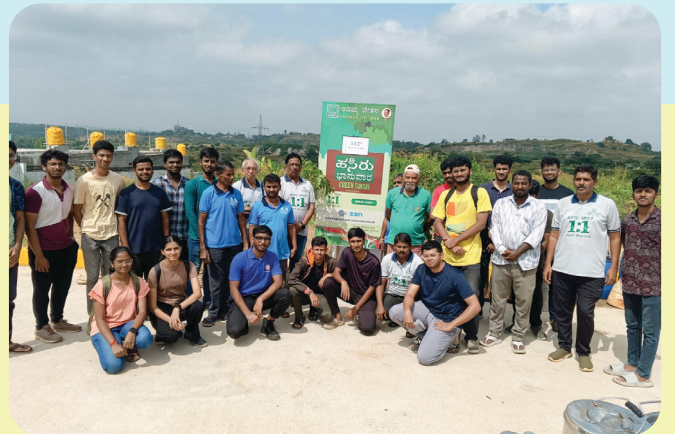
ಅದಮ್ಯ ಚೇತನದ ಹಸಿರು ಭಾನುವಾರ 512ನೇ ಹಸಿರು ಭಾನುವಾರ ಕಾರ್ಯಕ್ರಮ ಬೆಂಗಳೂರಿನ ಬನ್ನೇರುಘಟ್ಟ ರಸ್ತೆಯ ಗೊಟ್ಟಿಗೇರೆ ಪಿಲ್ಲಗಾನಗಲ್ಲಿ ಹಿಂದು ರುದ್ರಭೂಮಿಯ ಆವರಣದಲ್ಲಿ ಯಶಸ್ವಿಯಾಗಿ ಜರುಗಿತು.