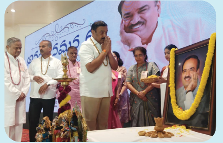
ನವೆಂಬರ್ 22 ರಂದು ಅನಂತ ಸ್ಮರಣೆ- ಅನಂತ ಪ್ರೇರಣೆ ಕಾರ್ಯಕ್ರಮದಲ್ಲಿ ವಿವಿಧ ಗಣ್ಯರು ಭಾಗಿಯಾಗಿ ಅನಂತಕುಮಾರ್ ಅವರ ಭಾವಚಿತ್ರಕ್ಕೆ ಪುಷ್ಪ ನಮನ ಸಲ್ಲಿಸಿ ಗೌರವ ಸಮರ್ಪಿಸಿದರು.