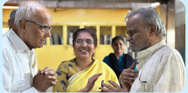
ಡಾ. ಎಸ್. ಎಲ್. ಭೈರಪ್ಪ ಅಗಲಿಕೆಗೆ ಅದಮ್ಮ ಚೇತನ ಸಂಸ್ಥೆ ಮತ್ತು ಅನಂತಕುಮಾರ್ ಪ್ರತಿಷ್ಠಾನದ ಪರವಾಗಿ ಶ್ರದ್ಧಾಂಜಲಿಯನ್ನು ಸಲ್ಲಿಸುತ್ತೇವೆ.

ಅದಮ್ಮ ಚೇತನ ಸಂಸ್ಥೆಯ ಸೇವಾ ಚಟುವಟಿಕೆಗಳ ಬಗ್ಗೆ ಸ್ವತಃ ಆಸಕ್ತಿ ತೋರಿದ ಭೈರಪ್ಪ ಅವರು, ಗವಿಪುರಂನಲ್ಲಿರುವ ನಮ್ಮ ಕಚೇರಿಗೆ ಬಂದು ಕಾರ್ಯಗಳ ಬಗ್ಗೆ ತಿಳಿದುಕೊಂಡು ಅಪಾರ ಸಂತೋಷ ವ್ಯಕ್ತಪಡಿಸಿದ್ದರು. ಶ್ರೀ ಅನಂತಕುಮಾರ್ ಅವರೊಡನೆ ಕಳೆದ ಕ್ಷಣಗಳನ್ನು ಅವರು ಮೆಲುಕು ಹಾಕಿ, ಅವರ ರಾಷ್ಟ್ರಭಾವನೆಯನ್ನು ಶ್ಲಾಘಿಸಿದ್ದರು.